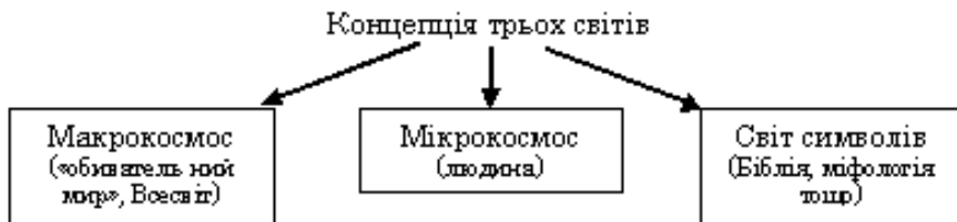
Рис. 1. Концепція трьох світів

Всі світи складаються з двох натур: внутрішньої (духовної) і зовнішньої (матеріальної).